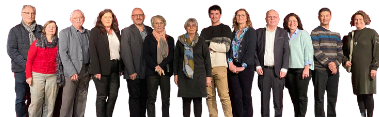
Votre équipe municipale