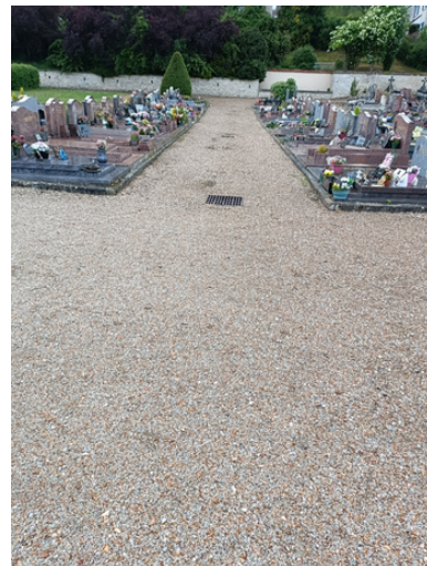
Cimetière de Guerville