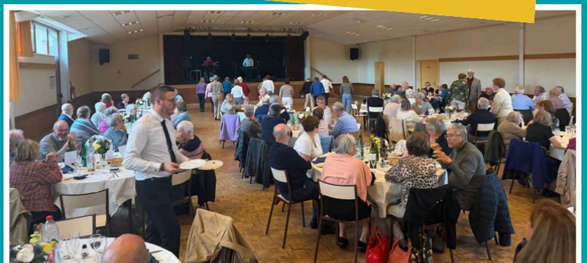
12 mai : CCAS, repas des séniors