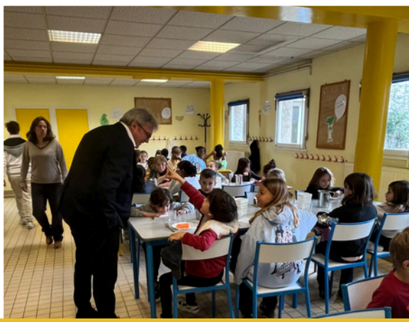
30 mars : Visite de M. le Maire à la cantine