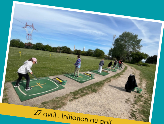
27 avril : Initiation au golf