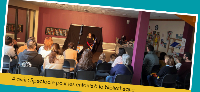
4 avril : Spectacle pour les enfants à la bibliothèque