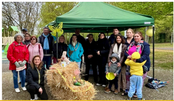
5 avril : Chasse aux œufs de la LIPEG