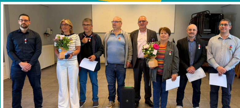
8 mai : Remise des médailles du travail