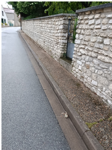
Rue de la Lombardie

A ce titre, des échanges ont été menés avec GPS&O afin de permettre une meilleure coordination des actions et une vision plus globale de l'entretien du territoire.