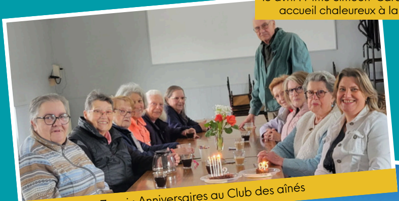
7 mai : Anniversaires au Club des aînés