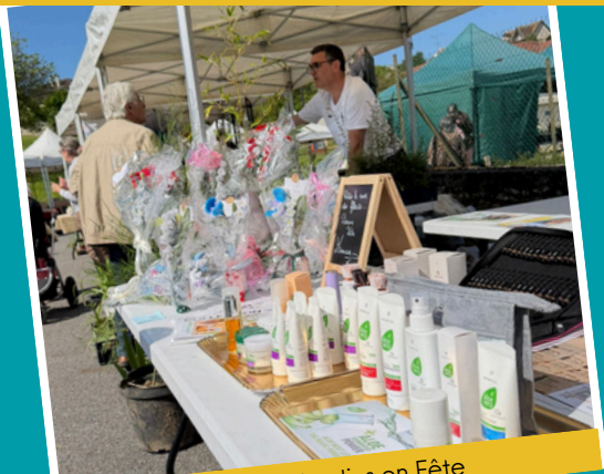
9 mai : Jardins en Fête